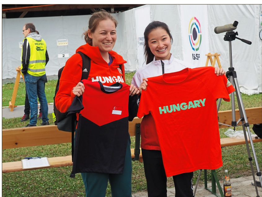
Verschiedene Nationen vereint – Sport verbindet.