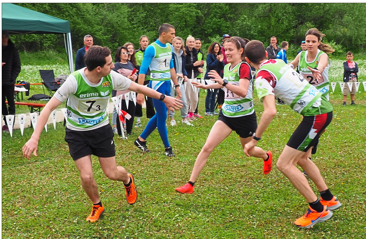
Fliegender Wechsel beim Sprint.