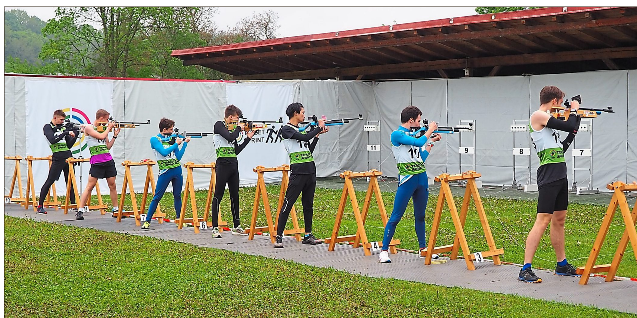
Am Schießstand galt es, den Puls in den Griff zu bekommen.