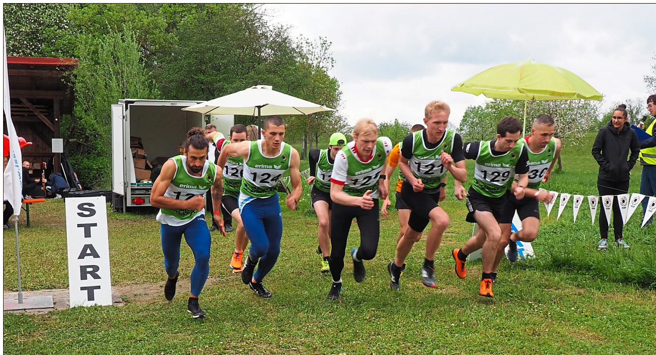
Hochmotiviert wurde gestartet.